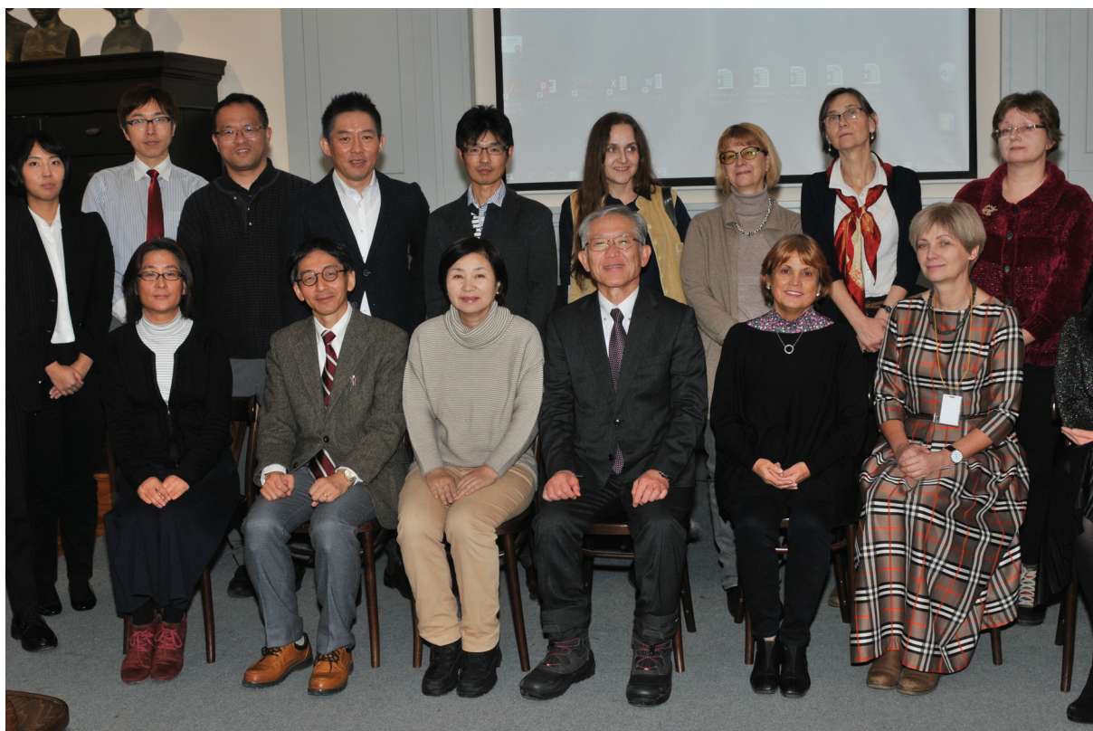
Foto 1. Participants of the conference